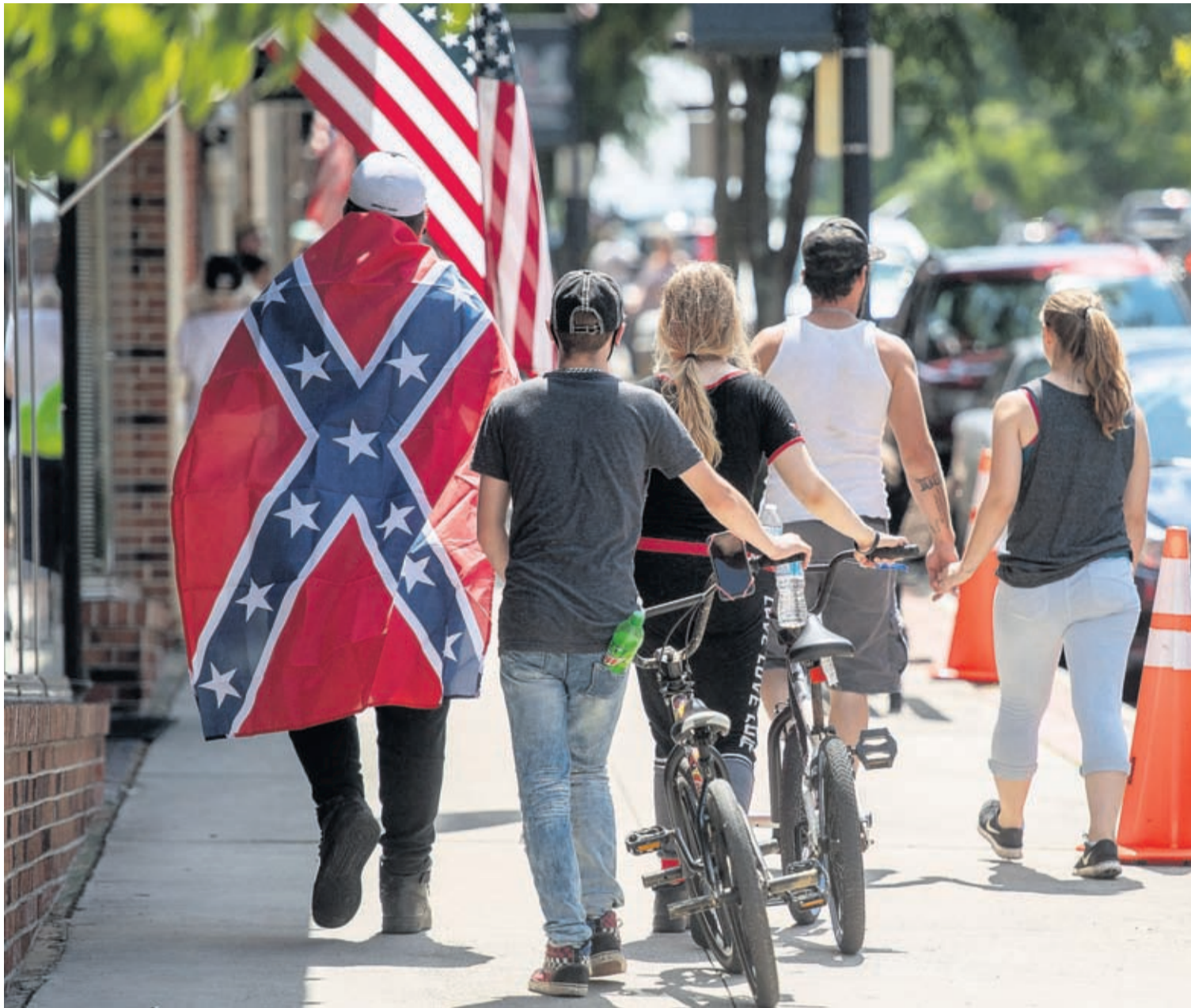
In this July 3, 2020, file photo a man wears a Confederate flag while walking with others in Marion, Va.